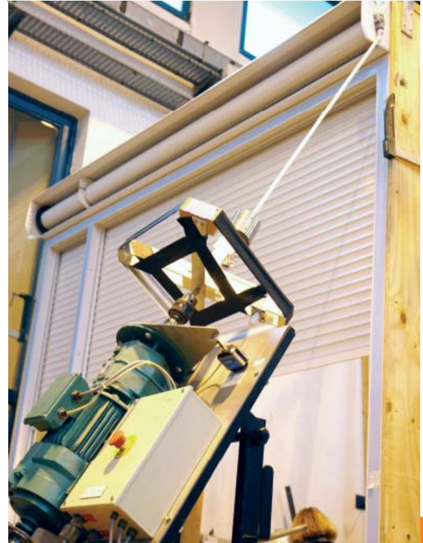
Banc d'ensoleillement : les tabliers sont soumis durant 6 heures à des températures de 50° pour les tabliers blancs et clairs et 70° pour les tabliers foncés, puis subissent des chocs thermiques.